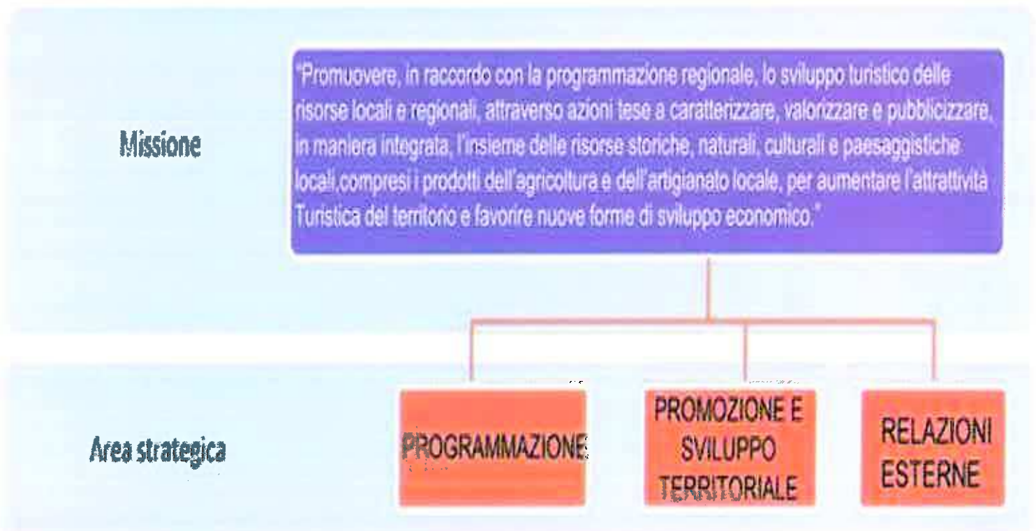
FIGURA 1 – MISSIONE, AREE STRATEGICHE

La coerenza tra il Piano della Performance, il Piano Triennale per la Prevenzione della Corruzione e il Programma Triennale per la Trasparenza e l'Integrità viene, quindi, realizzata sia in termini di obiettivi, indicatori, target e risorse associate, sia in termini di processo e modalità di sviluppo dei contenuti.